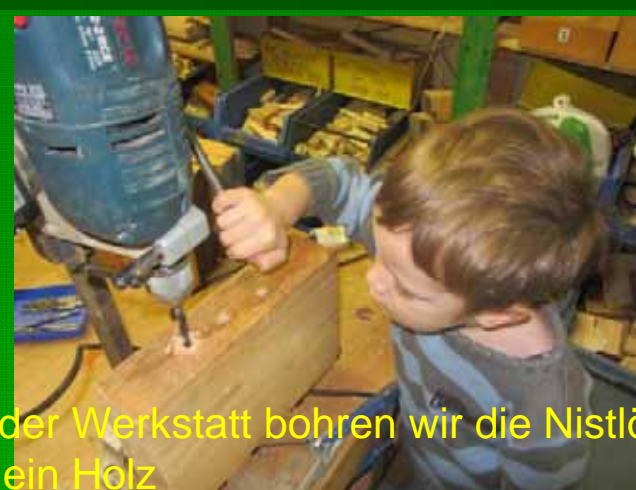
...in der Werkstatt bohren wir die Nistlöcher in ein Holz