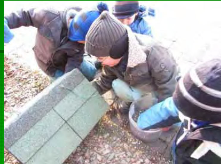
Eiskunst und Vogelfütterung