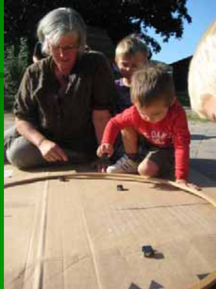
Erkunden von Solarspielen