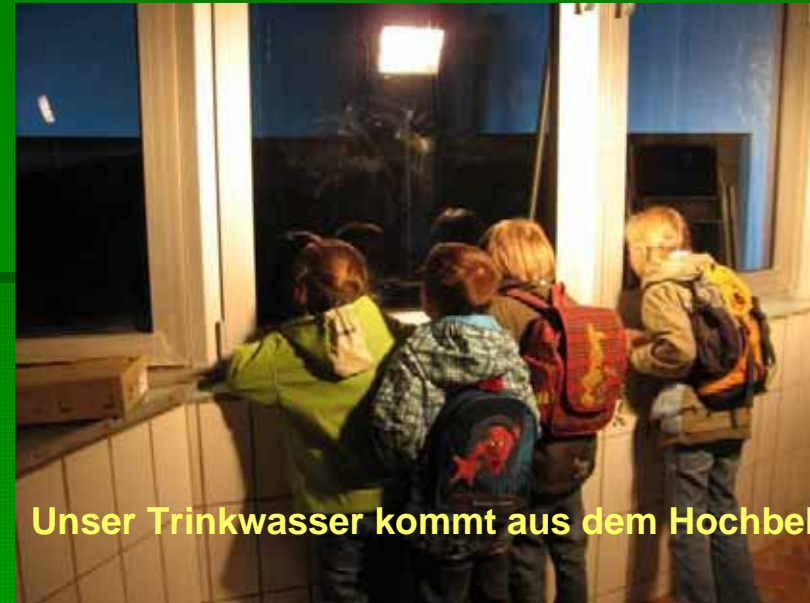
Unser Trinkwasser kommt aus dem Hochbehälter