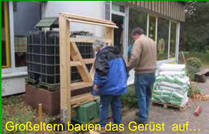
Großeltern bauen das Gerüst auf...