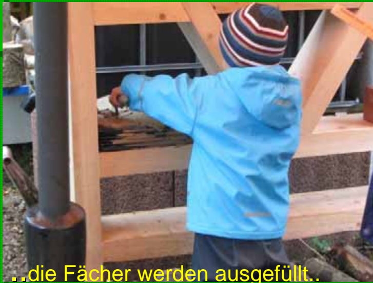
..die Fächer werden ausgefüllt..