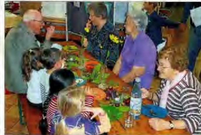
Es hat geschmeckt. Beide Generationen haben ihre Teller leer gegessen und haben viel Spaß beim „Geschichten erzählen“. Selbstverständlich ging es auch dabei hauptsächlich um die Kartoffel.

Geplant ist die Teilnahme der Kinder an den Säuberungsarbeiten der Nistkästen des Verkehrs- und Heimatvereins, die regelmäßig von den Senioren gereinigt und instand gehalten werden. rpk