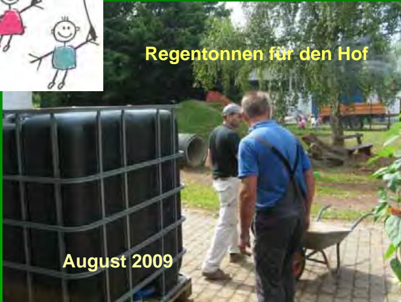
Regentonnen für den Hof